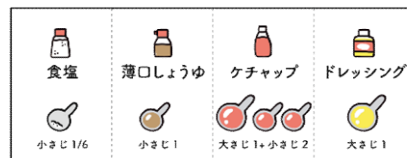
塩分1gが含まれる調味料量